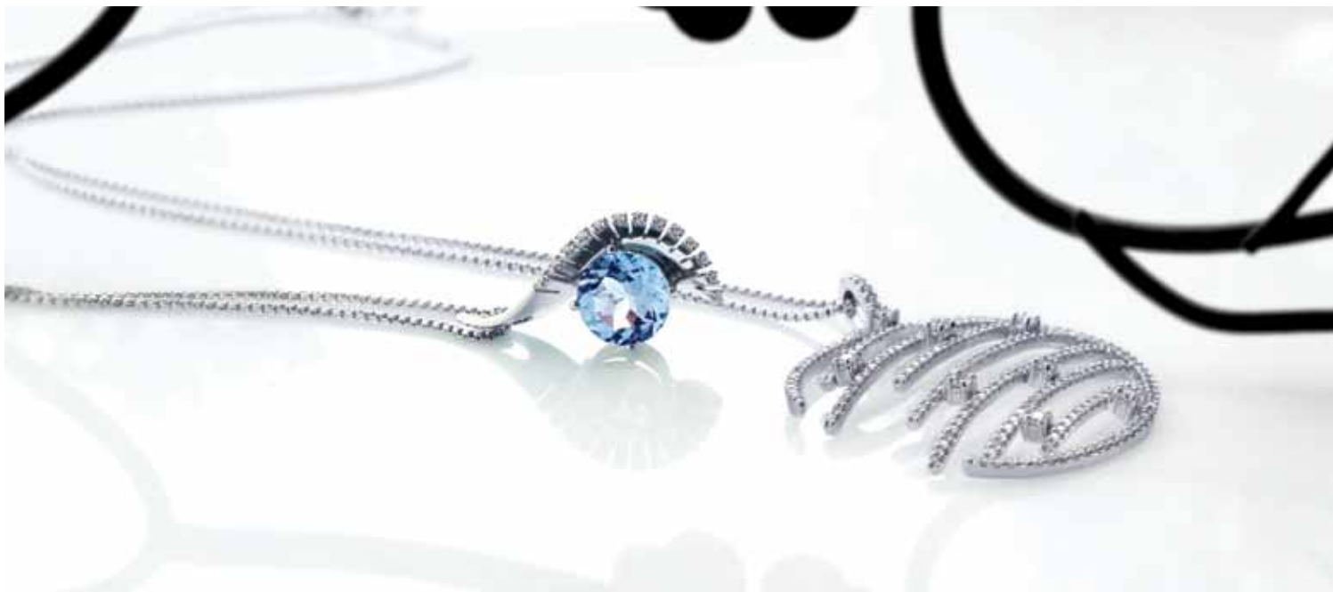
Symphony of Diamond Pendant : راست Jazzy Blue Topaz Diamond Pendant : چپ